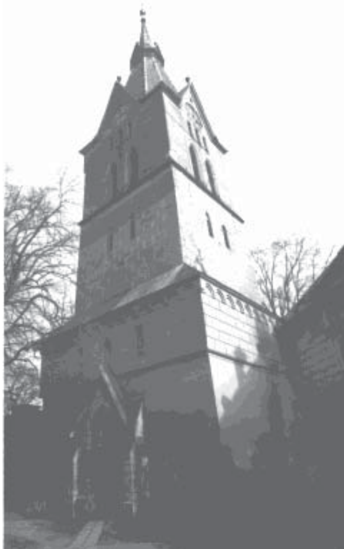
Glockengeläut für den Gottesdienst: Zeiden ist stolz, einen eigenen Pfarrer zu haben

Kleinschenk hat zwei Hektar Kartoffeln angebaut, wir Zeidner dagegen 93, das sind schon andere Dimensionen. Man hätte von Anfang an, als man diese Reform durchgeführt hatte, nur