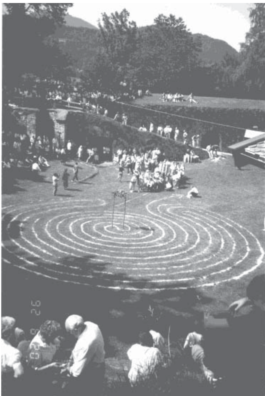
Der Wunderkreis gehörte auf der Kufsteiner Burg zu den Höhepunkten des Schulfestes