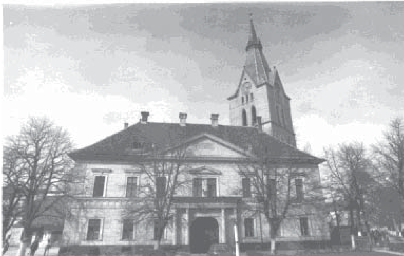
In gutem Zustand befinden sich nach Aussagen von Kurator Arnold Aescht die Kirche und ihre Gebäude

Im übrigen hilft die Kirche bei Festen aus, wenn zum Beispiel ein Chor oder eine Theatergruppe zu Besuch kommt. Diese Gäste werden dann traditionell mit Brötchen und einem Glas Wein begrüßt. So haben wir im letzten Monat 1000 Gäste bewirtet.