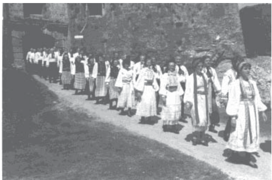
Auf jeder Veranstaltung nach wie vor eine Augenweide: die Tracht

Samstag war Richttag mit Berichten, Aussprachen und Neuwahlen.