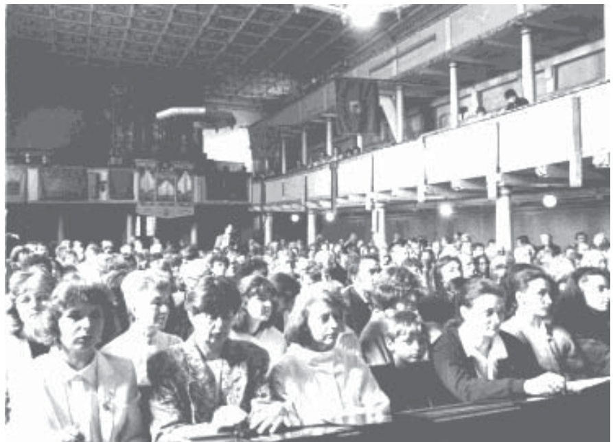
Etwa dreihundert Sängern von elf Chören beteiligten sich am zweiten Treffen in Zeiden, das sich durch anspruchsvolle Darbietungen auszeichnete