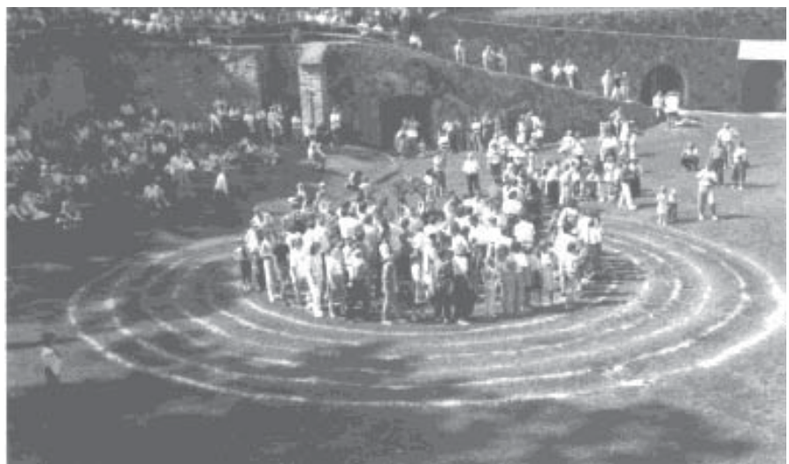
Im Gänsemarsch defilierten die Zeidner begeistert im Wunderkreis