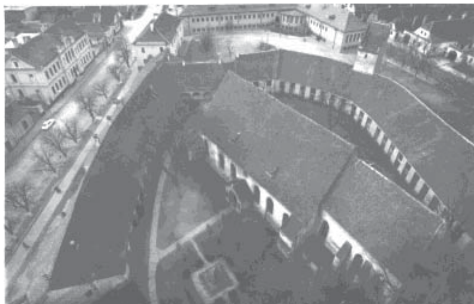
Die Kirche ist nach wie vor – heute mehr denn je – Treffpunkt wichtiger Veranstaltungen

Die Landesgruppe Baden-Württemberg spendet für die Zeidner Aktion der Altenküche 1000 Mark.